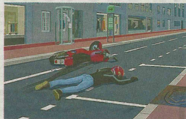
Des options de comportements sont proposées à chaque scène.

Lorsque j'ai voulu me former au secourisme il a fallu que j'attende 8 mois. L'idée de créer un logiciel pour réduire le temps de formation sur la partie théorique est